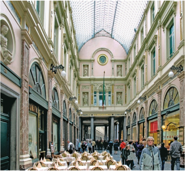
Galeries Royales Saint-Hubert in Brüssel, 1846/47 von Jean-Pierre Cluysenaar erbaut.