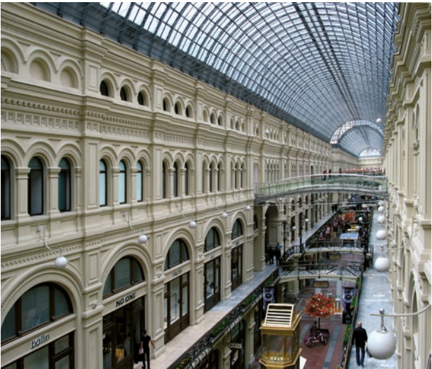
Kaufhaus GUM in Moskau, 1888–1893 entstanden.