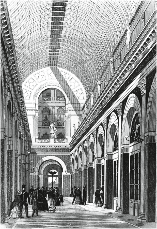
Sillem's Bazar in Hamburg, 1845. Erster Passagenbau in Deutschland.

in Karawansereien (Raststätten für Karawanen) untergebracht, die den Basarkomplexen angelagert sind, heute aber zunehmend anders genutzt werden. Es gibt recht unterschiedliche Basartypen, die oft ein ganzes Labyrinth von Gassen bilden. Sie können als Linien-, Flächen- oder Kreuzbasare organisiert sein. Auch Hallenbasare kommen vor. Meist sind sie das Ergebnis eines langen Wachstums. Ihre Eingänge, Kreuzungspunkte oder aber die Höfe der Khane können prachtvoll ausgestaltet sein. In den Gassen der Basare, die in der Regel nach Branchen gegliedert sind, sitzen die Verkäufer oder Handwerker auf seitlich angeordneten Podesten, die als Mastaba