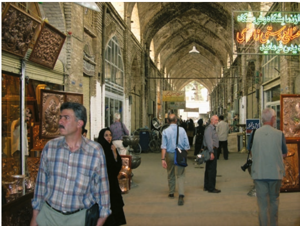
Basar in Isfahan, Iran.

Drei entscheidende Kriterien grenzen die Passagen gegen verwandte Bauten ab: Das Glasdach, die symmetrisch ins Gebäude hineingezogenen Straßenfassaden und die zwei oder mehr Straßen verbindende Fußgängerzone, die beiderseits mit Läden besetzt ist. »Das Thema orientalischer Bazar ausgeklammert, bleibt die Passage eine Erfindung, eine Antwort auf einen unmittelbaren Bedarf der Gesellschaft zu einer bestimmten Stunde ihrer zivilisatorischen und industriellen Entwicklung ... Die Passage kommt in Mode, weil die Straße sich noch in mittelalterlichem Zustand befindet« (Lit.: Geist, S. 90). Geist hat die Entwicklung des Passagenbaues in sechs Etappen gefasst: 1. bis 1820 – die Erfindung, 2. 1820 bis 1840 – die Mode, 3. 1840 bis 1860 – die größere Dimension, 4. 1860 bis 1880 – die monumentale Phase, 5. 1880 bis 1900 – der Zug ins Gigantische, 6. nach 1900 – Verfall der Raumidee.