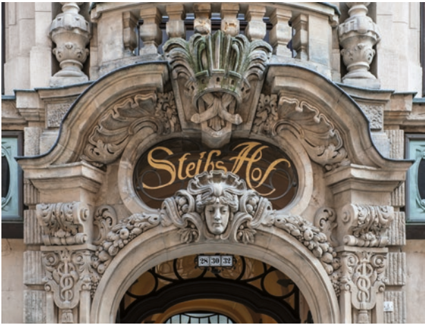
Detail des Sandsteinportals.