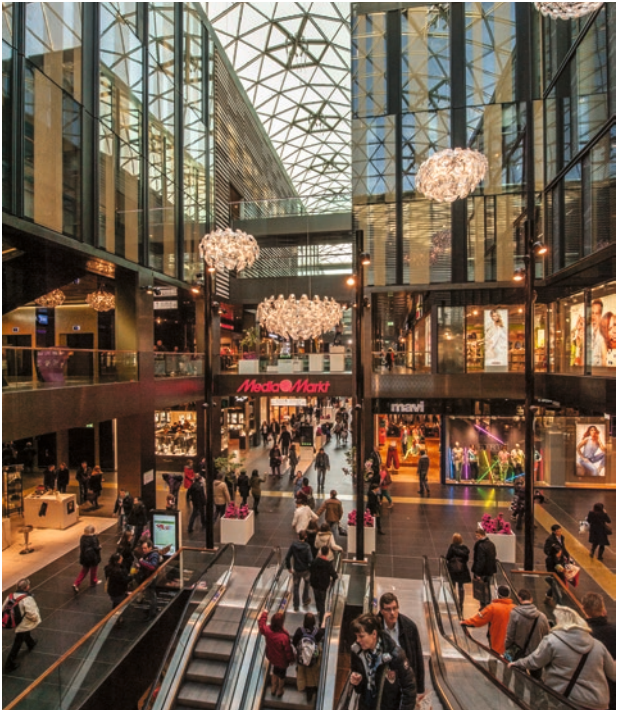
Höfe am Brühl in Leipzig. 2012 fertiggestellt.

im Hauptbahnhof kam 1994/1997 eine ganz neue städtebauliche Qualität hinzu. Mit dem Bau des »Petersbogen« zwischen Petersstraße und Burgstraße in den Jahren 1999 und 2001 ist eine der letzten schmerzlichen Baulücken des Zweiten Weltkrieges im Stadtzentrum geschlossen. Eine weitere Passage wurde mit der »Marktgalerie« im Zuge der Bebauung der Marktwestseite 2005 fertiggestellt. Die Höfe am Brühl entstanden in den Jahren 2010 bis 2012.