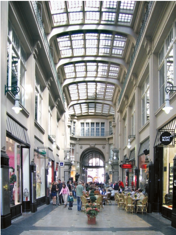
Mädlerpassage in Leipzig, 1912/14 errichtet.

den Anspruch des Leipziger Bürgertums auf die Stellung als führende europäische, ja als Weltmessestadt in dieser Zeit. In der funktionellen Verbindung von Messepalast und Passage entstand in Leipzig eine neue Geschäftshausarchitektur der Mustermesse, die unter veränderten wirtschaftlichen Bedingungen an die Tradition des barocken Durchhauses anknüpfte und zugleich einen originären Beitrag zum Geschäftshausbau in Europa leistete.