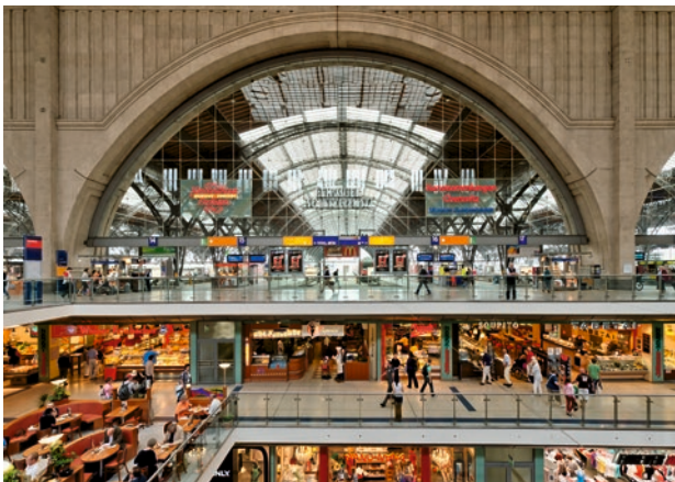
Blick in die Querbahnsteighalle mit den darunter liegenden zwei Verkaufsetagen.

größte Spannweite 45 m beträgt. Sie wurden von den Ingenieuren Eilers und Karig konstruiert. Im Hauptbahnhof verbindet sich kühnes ingenieurtechnisches Denken mit meisterhafter baukünstlerischer Gestaltung. An dem 1906 ausgeschriebenen Wettbewerb für das Empfangsgebäude hatten sich 76 Architekten beteiligt. Der preisgekönte Entwurf der Dresdner Architekten William Lossow und Max Hans Kühne, der in einigen Details verändert wurde, gelangte schließlich zur Ausführung. Die mit Postaer Sandstein verkleidete Außenfassade des Baues weist interessante Bauplastiken auf. In den Fensterpfeilern der westlichen Eingangshalle sind Bauberufe, in denen der östlichen typische Leipziger Berufe dargestellt.