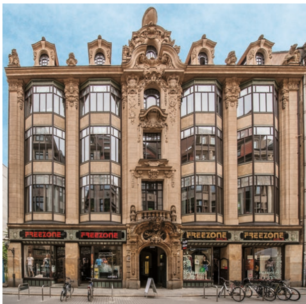
Hausfront mit Sandsteinportal an der Nikolaistraße.

Zwei Löwenplastiken als Wappenhalter seitlich über dem Hauptgesims »bewachen« das Geschäftshaus. In einer Kartusche in der Fensterbekrönung des zwei-