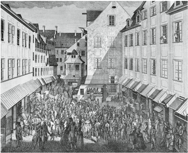
Messetreiben in Auerbachs Hof, Kupferstich von Johann August Roßmähler aus dem Jahre 1778.

von einer Straße zur anderen führenden Durchgangshäuser« (Lit.: Bethe, S. 134) erbaute (im Zweiten Weltkrieg zerstört). Die Baufreudigkeit des Handelsbürgertums fand ihren künstlerischen Höhepunkt in diesen homogen durchgestalteten Durchgangshäusern (oder Durchhäusern) des 18. Jahrhunderts. Die bis dahin überwiegend