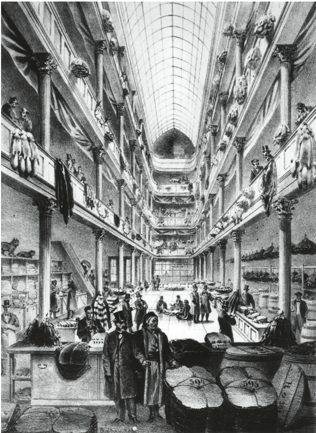
Lomersche Pelzhalle am Brühl 42 in Leipzig, 1857 erbaut (Lithografie von J. G. Bach 1864).

noch eine größere Anzahl von Passagen, teils im Originalzustand, erhalten. So etwa die Galerie Vivienne (1823) und die Passage Colbert (1826) an der Rue des Petits Champs, die beide miteinander verbunden sind. In dieser frühen Phase sucht man Passagen in Leipzig noch vergeblich.