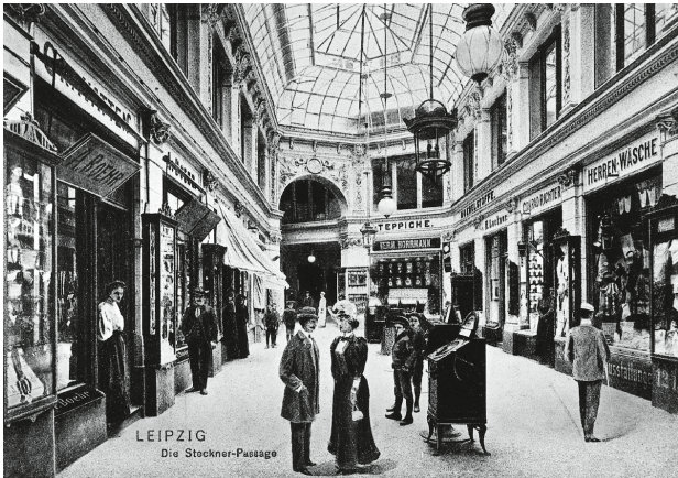
Steckner-Passage in Leipzig, 1873.

erneut zum Durchgangshof – nun wieder Ledigs Hof genannt – machen, indem er einfach die Glasdächer über den Lichthöfen entfernte.