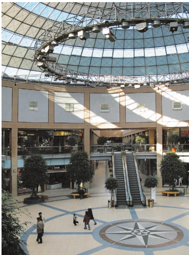
Allee-Center in Leipzig-Grünau.

und mit gläsernen Brüstungen versehen. Brücken verbinden die gegenüberliegenden Passagenbereiche. Das Allee-Center übertrifft alle anderen Leipziger Neu-Passagen in Dimension, Großzügigkeit und Lichttransparenz. Die fast schwerelos wirkende Glaskuppel stellt überdies einen gültigen Beitrag zur Leipziger Baukultur dar.