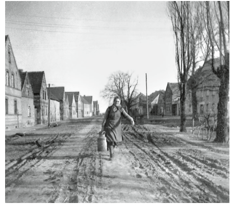
Dorfstraße um 1950

Mit der Neugliederung infolge der Bodenreform 1946 erhielten 32 Familien in Beerendorf Grund und Boden. Von 1946 bis 1949 wurden im Dorf vom Rittergut aus bis zur Mühle neun neue Neubauernhäuser erbaut, in Beerendorf-Ost drei. In dieser Zeit stieg auch die Bevölkerungszahl in Beerendorf. Prekär wurde es für die kleine Dorfschule. Hier waren die Kinder in den acht Klassen kaum unterzubekommen.