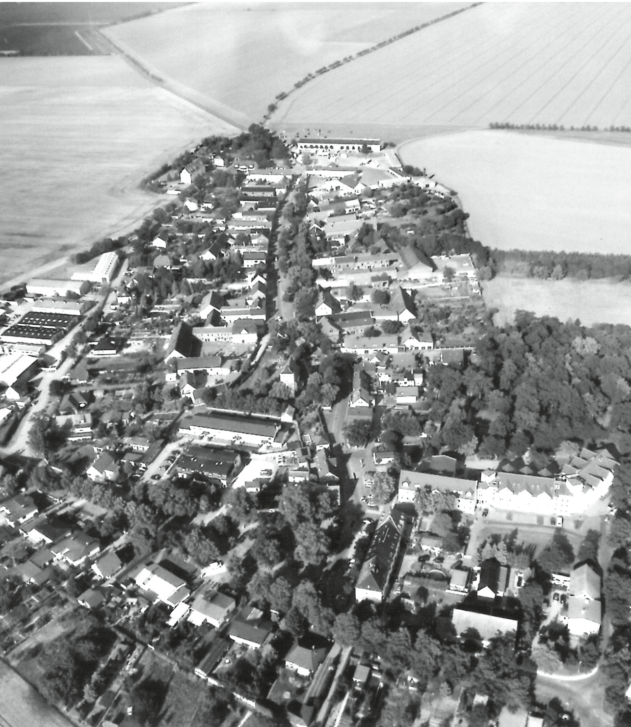
Luftaufnahme aus Richtung Westen auf den Ort