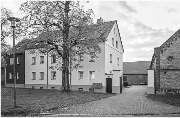
Wohnhaus Familie Rinke