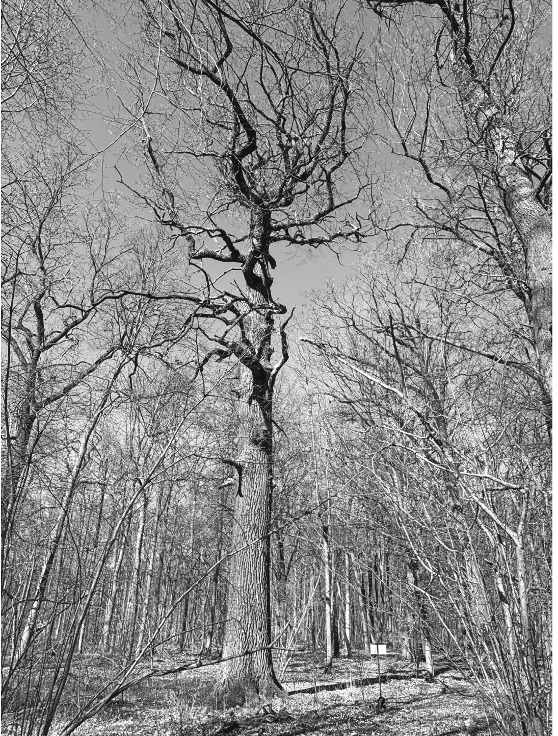
Die Adolf-Tauche-Eiche ist mit geschätzten rund 370 Jahren der älteste Baum in der Spröde. Auf einem Schild neben der Eiche gibt es einige Erläuterungen zu diesem Naturdenkmal.