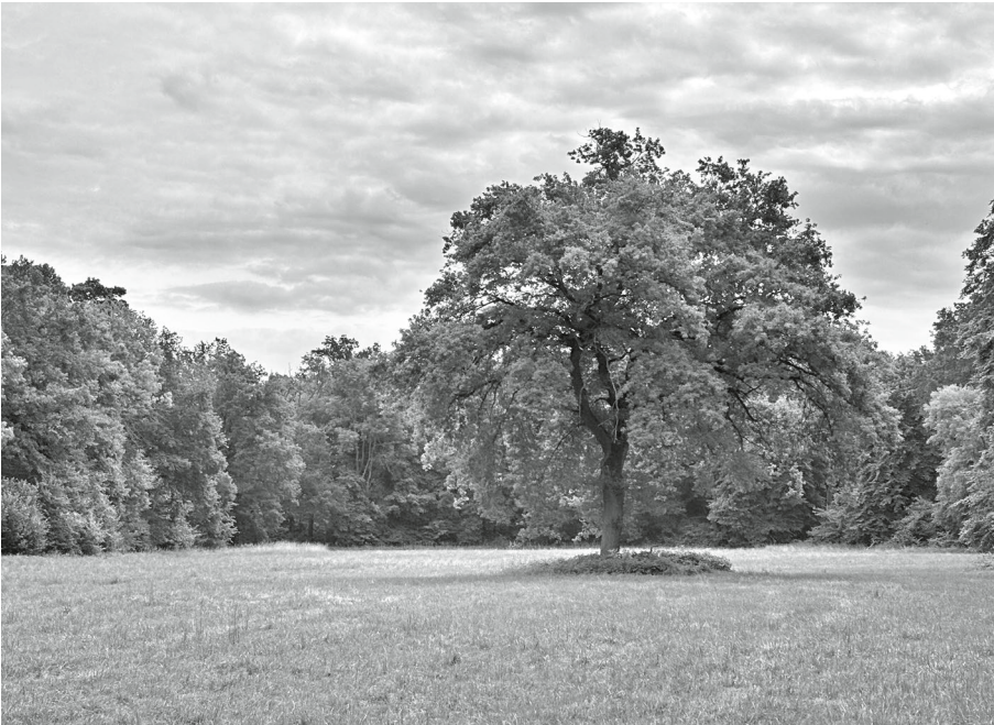
Als wertvoll gilt diese Wiese im Naturschutzgebiet. Geschützt ist sie wegen ihrer Artenvielfalt und weil sie als Entwicklungsfläche für Schmetterlinge gilt.