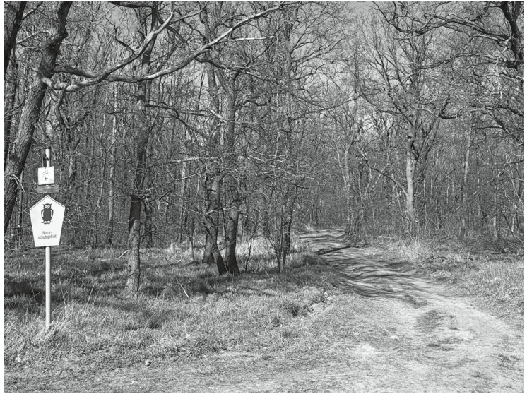
Das gelbe Schild mit der Eule verweist auf das Naturschutzgebiet »Spröde«.

Im Frühjahr bietet sich in der Spröde, wenn die unter Naturschutz stehenden Buschwindröschen großflächig blühen, nicht nur für Naturliebhaber ein besonderer Anblick.