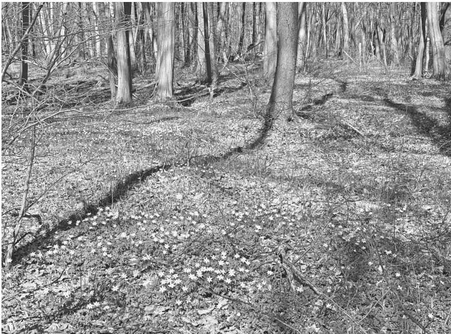
Frühjahr in der Spröde. Unter den Laubbäumen bilden die Buschwindröschen teils ganze Blütenteppiche.