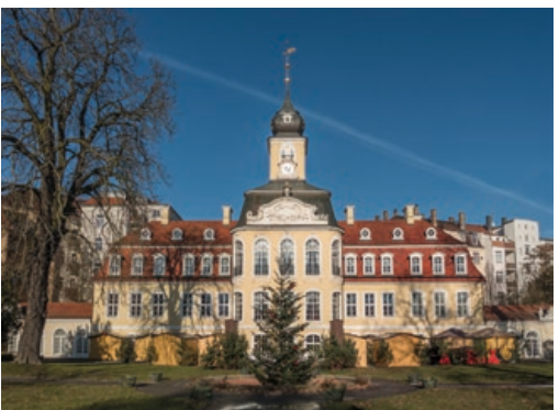
12 Gohliser Schloßchen

Das neue Zentralstadion als »Red-Bull-Arena«, hervorgegangen aus dem 1954–1956 erbauten »Stadion der Hunderttausend« im Sportgelände auf den Frankfurter Wiesen am Elsterflutbecken.