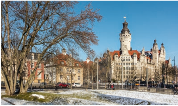
1 Neues Rathaus

Das Neue Rathaus mit dem 114 Meter hohen »Pleißenburg«-Turm, in den Jahren 1899 bis 1905 nach Plänen von Leipzigs Stadtbaudirektor Hugo Licht an der Südwestecke des alten Stadtkerns errichtet.