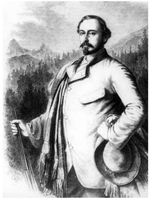
Herzog Ernst II. von Sachsen-Coburg und Gotha, Unternehmer der Abessinienreise 1862 (aus »Gartenlaube« 1860)

Die Coburger Archivalien sagen wenig über Anlässe, Motivationen oder Ziele der so plötzlich konzipierten Reise. Am fundiertesten äußert sich dazu der Herzog selbst in seiner Rückschau. 3 Ein Anreger ist der Gothaer Geograf August Petermann gewesen. In seinen »Mittheilungen« veröffentlichte er fortlaufend aktualisierte Berichte und Landkarten über neu erschlossene Gebiete. Ein beunruhigender Vorfall war das Verschwinden des Afrikaforschers Eduard Vogel schon 1856, das