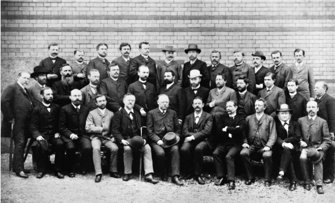
14 Das Lehrerkollegium um Rektor Otto Kaemmel (untere Reihe, 5. v.l.) im Jahr 1892.

beschwor die »sittlich-religiöse Festigung« als Teil umfassender humanistischer Bildung. Andachten und Religionsunterricht waren noch immer konstitutiv für den Gymnasialbetrieb, wenngleich nicht mehr in dem Maße wie in früheren Jahrhunderten.