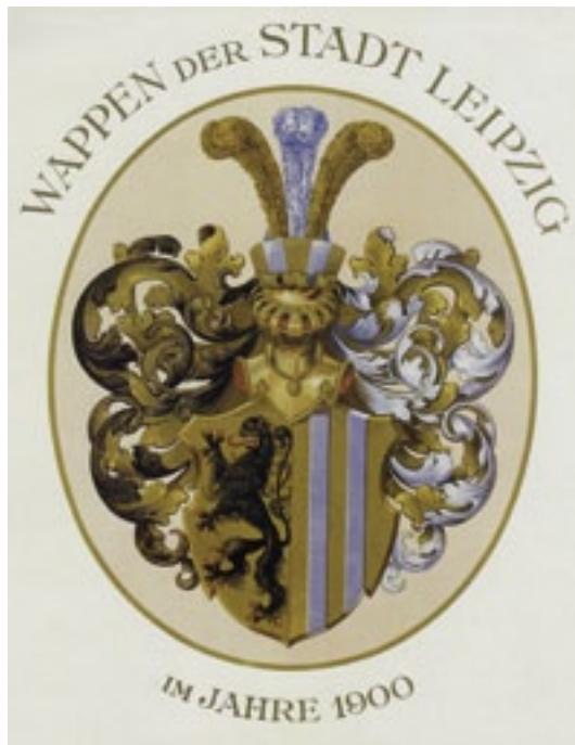
3 Blau-Gold-Blau waren die Farben der Nikolaishule und der Stadt Leipzig.

Während des Nationalsozialismus musste die Schule ihre humanistische Tradition in scharf geführten Debatten verteidigen und vor dem Ende bewahren. Bestimmungen des Regimes vereinfachten das Schulwesen im Deutschen Reich und gipfelten 1937 in einer Reichsreform, durch die die Nikolaishule zur Oberschule für Jungen umfunktioniert wurde. Den traurigen Tiefpunkt stellte die Zerstörung des Gebäudes im Dezember 1943 durch einen alliierten Bombenangriff dar.