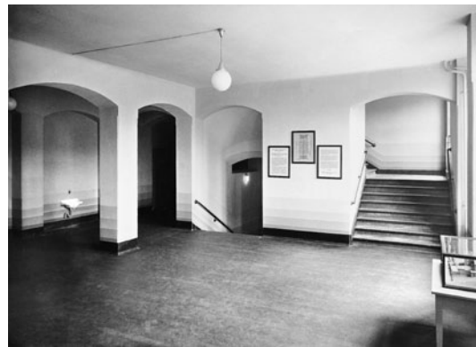
6 Das Treppenhaus der Nikolaischule in der Königstraße 1942.