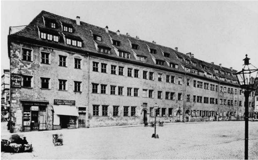
2 Das Gebäude der Alten Nikolaishule 1873, ein Jahr nach dem Umzug in die Königstraße.