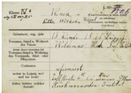
10 Glaubensvielfalt an der Nikolaischule. Otto Wenck zählte zu den reformierten Nikolai- tanern.