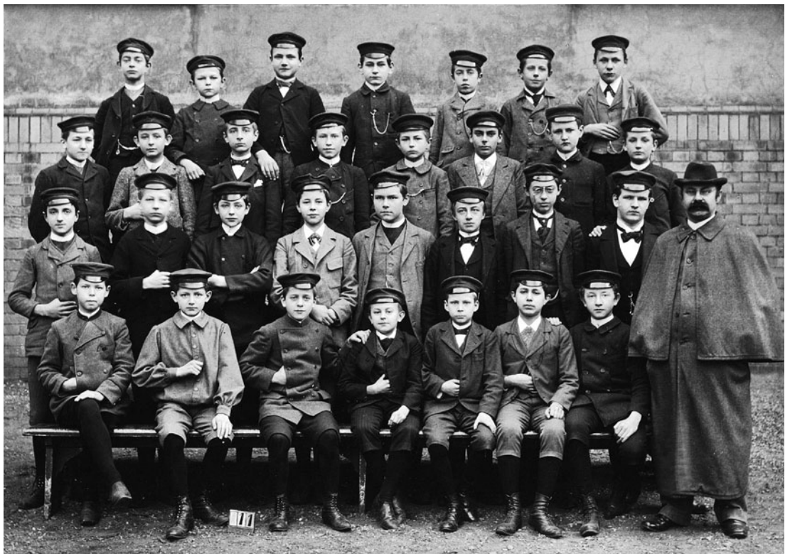
13 Nikolaitaner mit ihren Schülmützen um 1900.