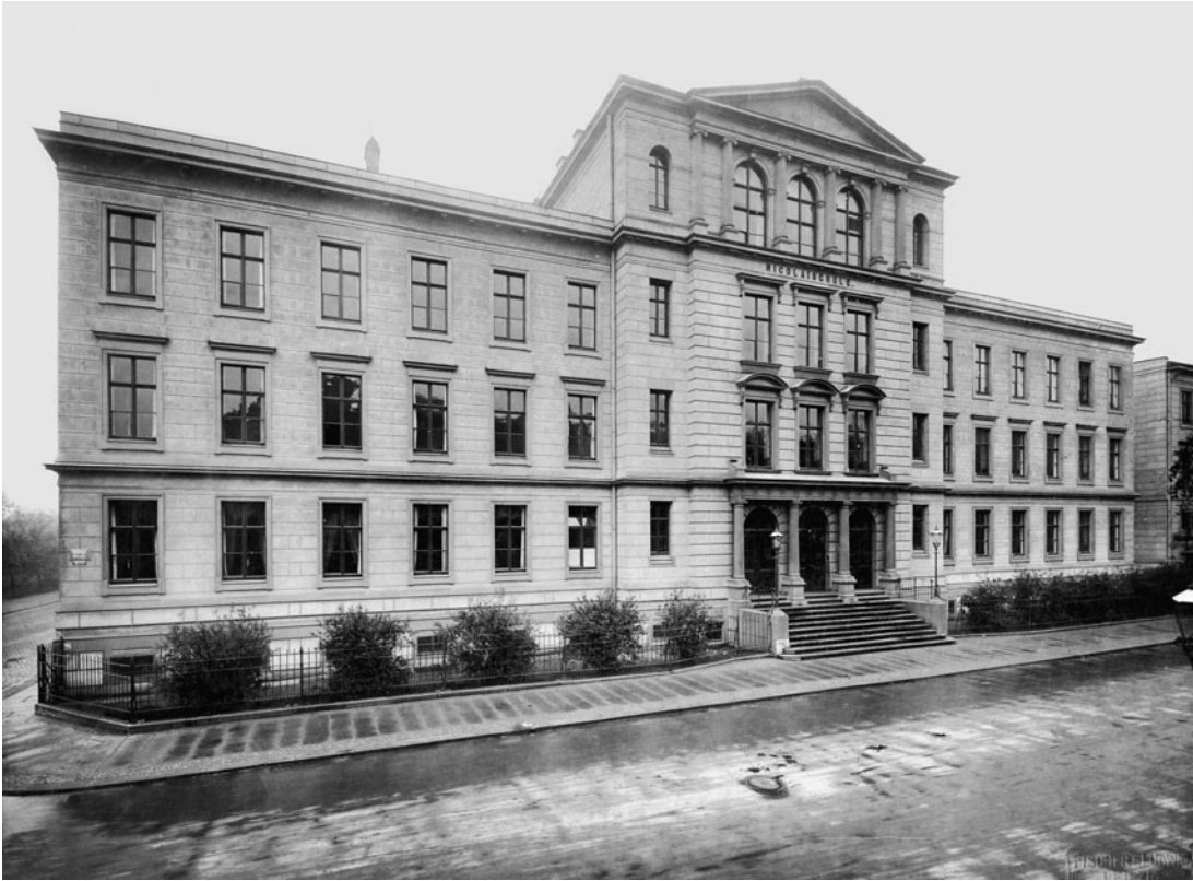
4 Die Nikolaischule in der Königstraße 1912.